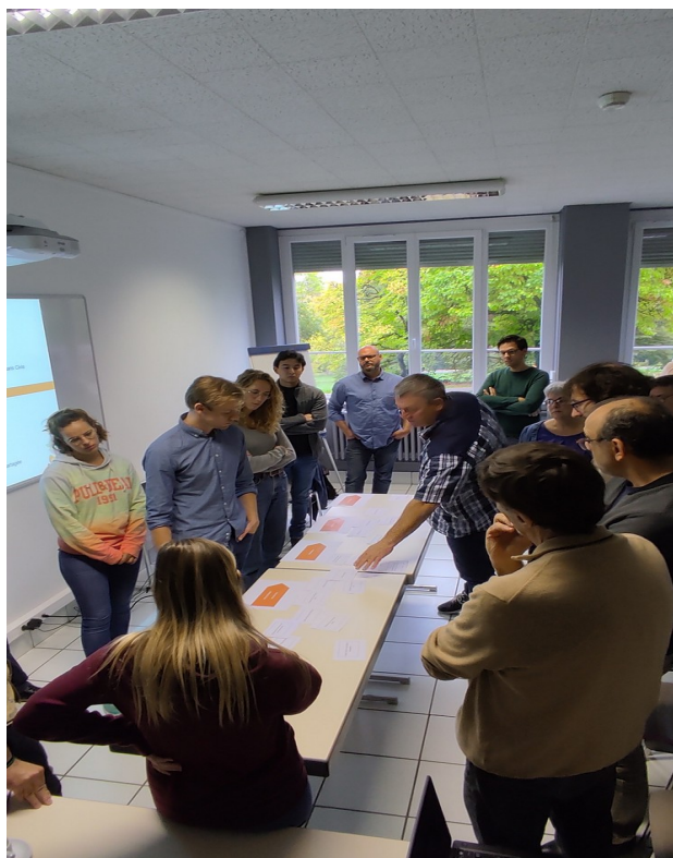
Une formation pour mieux connaître la filière PV au sol, comprendre le déroulement d'un projet et les ordres de grandeur économique, maîtriser le cadre réglementaire et tarifaire et s'exercer à qualifier l'opportunité d'un projet sur son territoire.